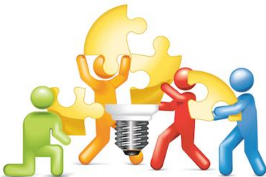
Etapa 5. Implementación del Plan de Acción.