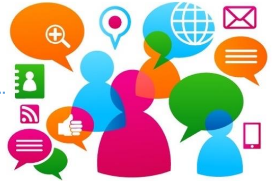
Etapa 3. Proceso para determinar la participación de la sociedad civil.