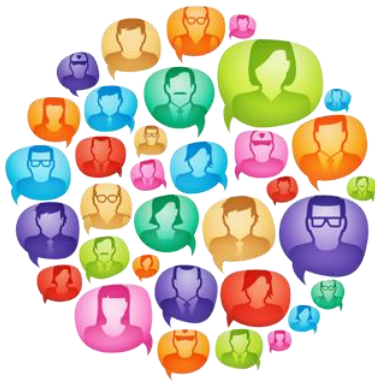
Etapa 4. Proceso de cocreación con la sociedad civil.