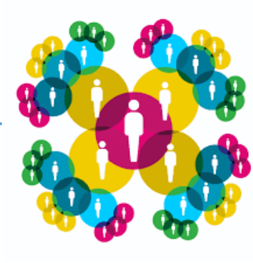
Etapa 2. Coordinación del Parlamento.